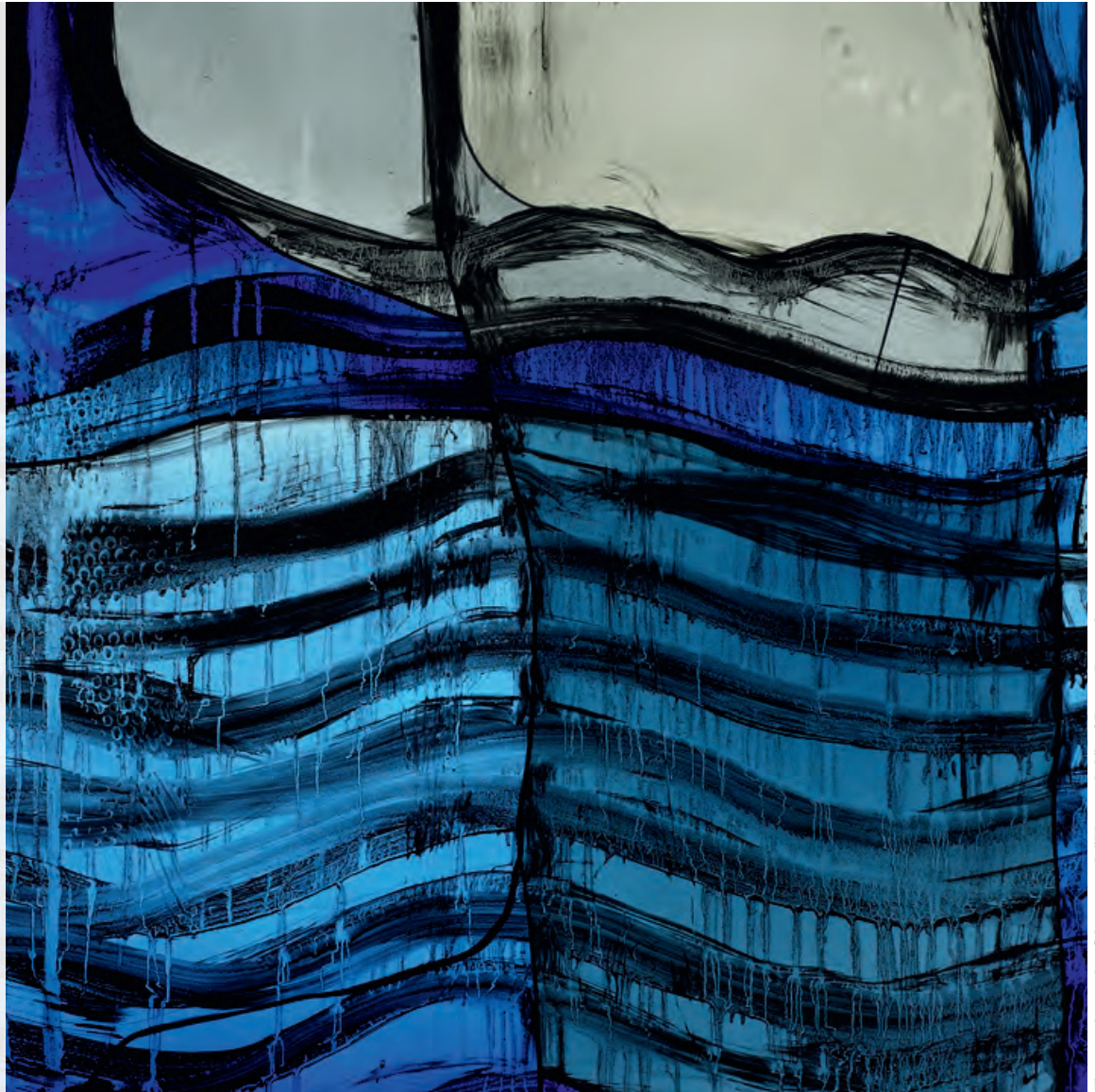
For- og bagside: Glasmosaik "Kristi dåb" af Peter Brandes.

Redaktion: Thue Petersen Grafisk layout: WindfeldtDesign ApS Tryk: Tarm Bogtryk A/S Papir: Munken Lynx