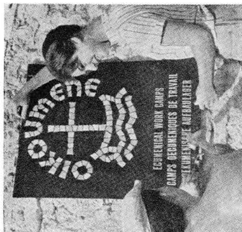
I økumeniske arbejdslejre mødes unge med forskellig kristen baggrund.

troforskelle. Drøftelserne, der angår forskellige opfattelser inden for den kristne tros lære, er mange og alvorlige og kommer til offentlighedens kundskab i fællesformuleringer, men aldrig med retslig gyldighed.