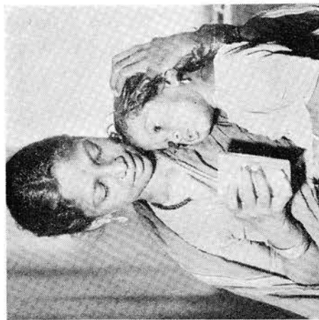
UNICEF – De Forenede Nations børnehjælpefond – har et omfattende hjælpearbejde i gang i Indien, og mange lande – deriblandt Danmark – yder landet direkte støtte. Skal vi kun tænke på det materielle?

For alt i verden nej. Der har været prædikeri nok i Indien. Indien trenger ikke til flere religiøse fløskler, men til at blive befriet for religionens åg. Hvis en eller anden ville rejse ud og inden for Hindu-samfundet arbejde for det, som vel var Jesu forkyndelses væsentligste formål: at få mennesker frigjort fra den trældom, som de religiøse fordomme og ceremonier