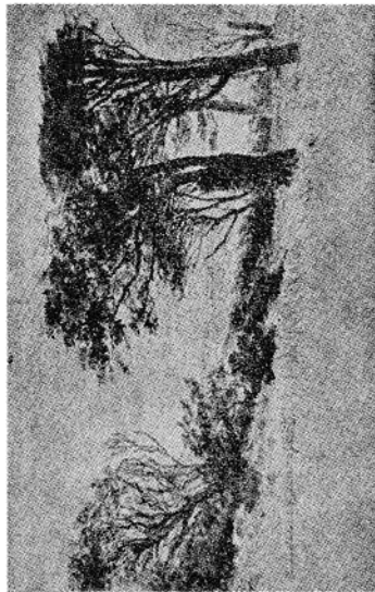
J. T. Lundbye: Efterårsstemning.