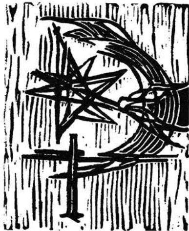
Grafik udført af: Elizabeth Eland