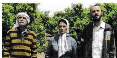
7. november: Citronlunden