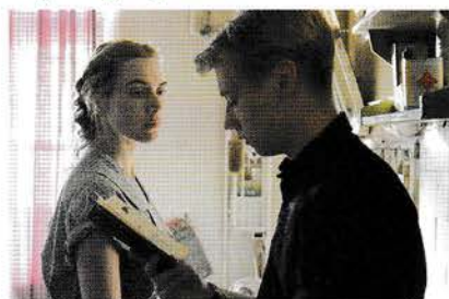
24. oktober: The Reader

Skyld og tilgivelse er temaet for efterårets tre film: