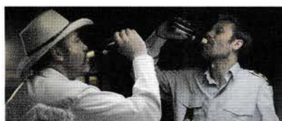
27. februar: Frygtelig lykkelig

Kirke og kino er en filmklub for dem, der både vil se film og diskutere dem med andre.