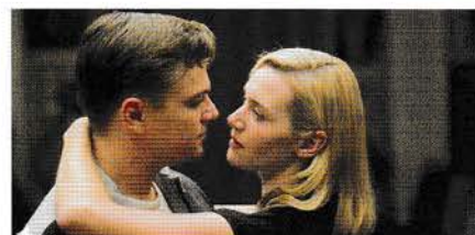
23. januar: Revolutionary Road

Forårets tre film er valgt efter temaet: Kærlighed og dømoni: