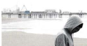
21. november: Boy A

Forårets tre film er valgt efter temaet: Kærlighed og dømoni: