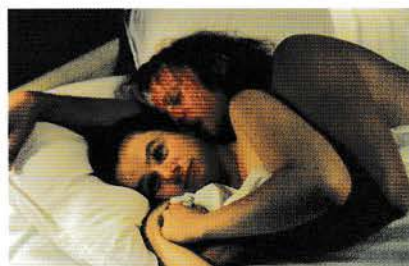
6. februar: Breaking the waves